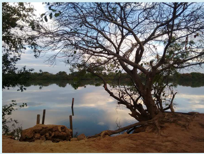
Janjanbureh – une destination de tourisme durable

La rubrique « Infos du Paysage de l'Année » a pour but de présenter aux lectrices et lecteurs divers aspects de la région.