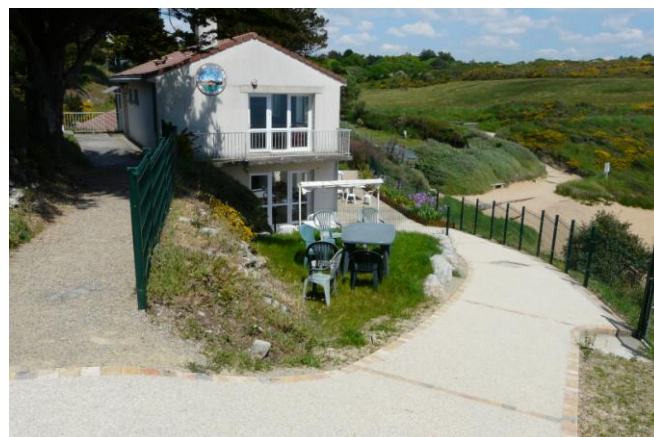
La pente d'accès au chalet de Préfailles